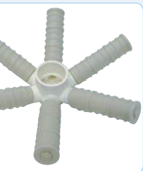
Сливное отверстие диаметром 50 мм внизу бака